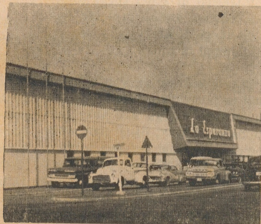
Esperanza Supermarket No. 2 Oranjestad